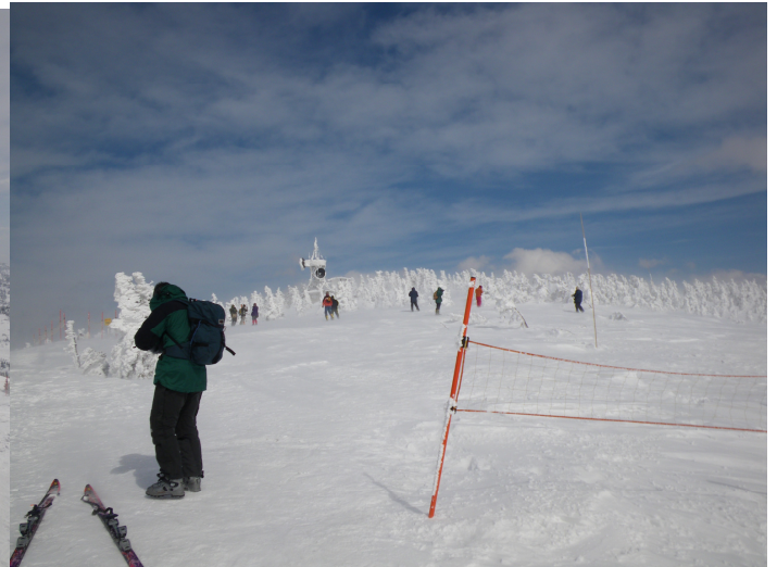
まさやんと小さくなったモンスター