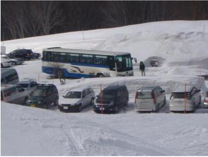
旅立ちのまさやん 青森市内へ