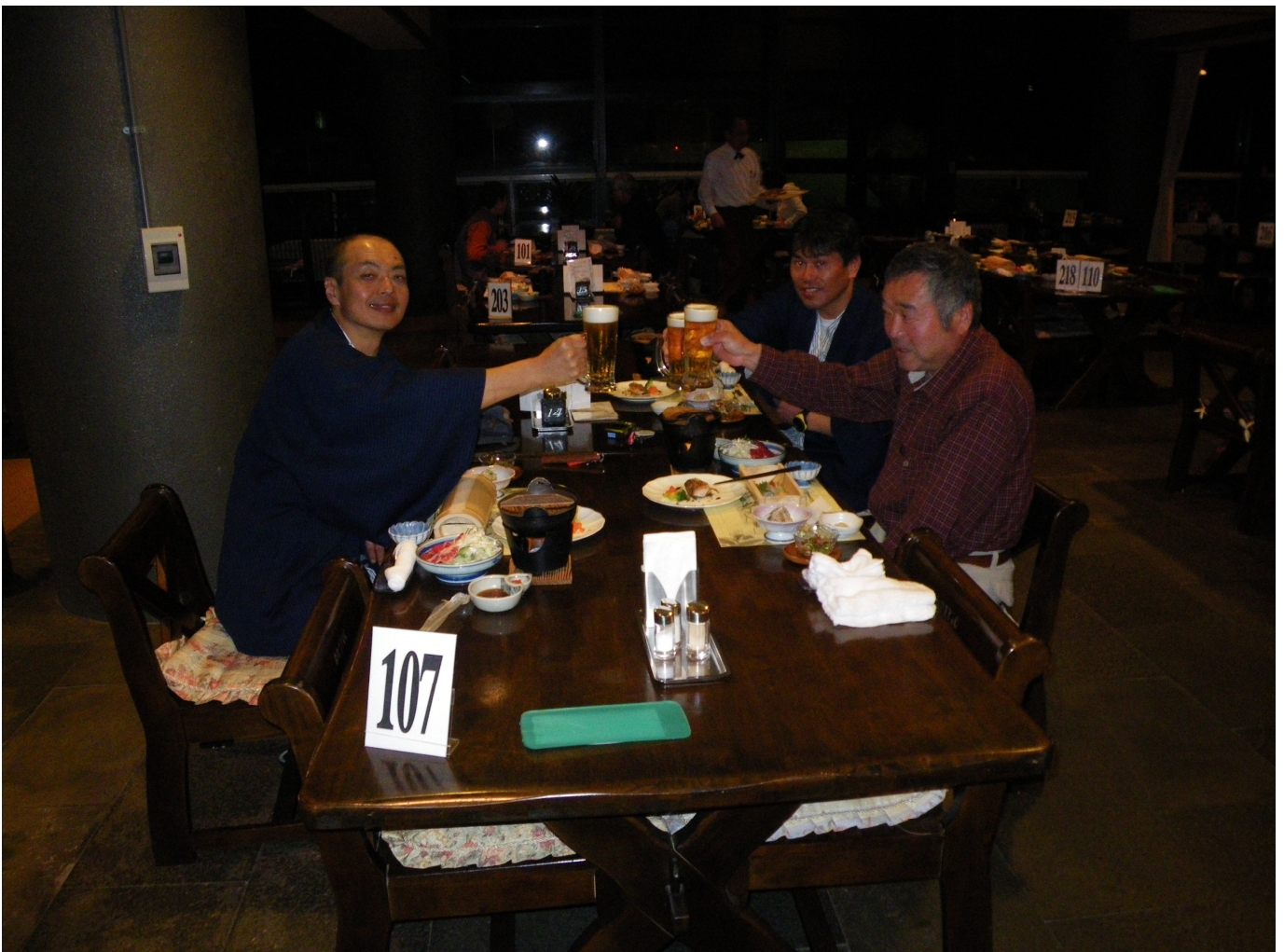
二日目の夜、サービスのプレミアムモルツ生で乾杯